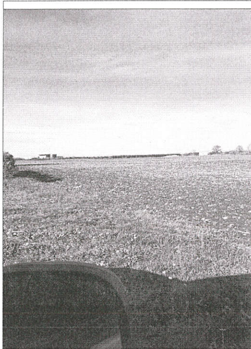
Illustration 3: Vue de la dislocation du phénomène.

Lecture faite par moi des renseignements d'état civil et de la déclaration ci-dessus, j'y persiste et n'ai rien à changer, à y ajouter ou à y retrancher.