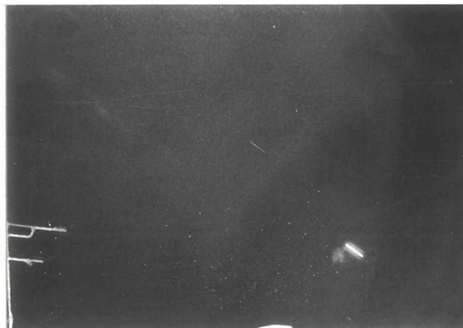
5ème cliché de l'objet pris à 20 heures 05' le 12 Janvier 1980