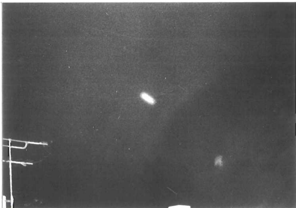
1er cliché de l'objet pris à 19 heures 45' le 12 Janvier 1980