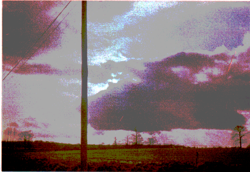
PLANCHE PHOTOGRAPHIQUE DE LA ZONE INDIQUEE PAR LES TEMOINS.