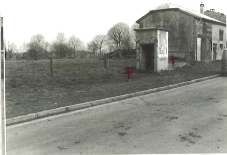
PRISE DE VUE N° 1

+ Localisation du point d'observation. Endroit où se trouvaient les témoins puis les Gendarmes à leur arrivée.