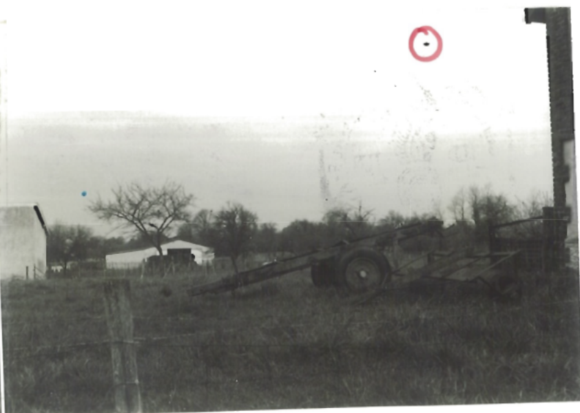
PRISE DE VUE N° 2

o Endroit où se trouvait l' O.V.H.I quand les deux témoins le voyait le plus près. (note: Présence du point sur la photo inexpliqué)