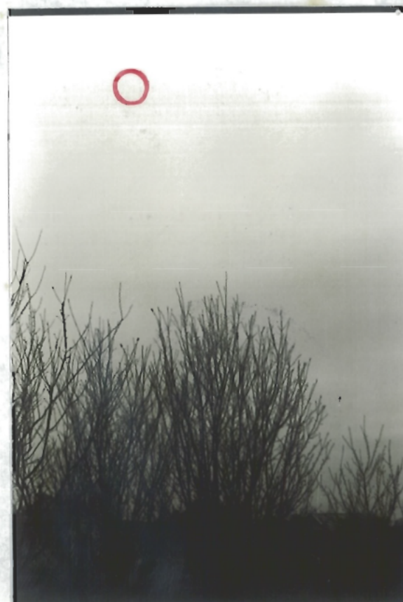
PRISE DE VUE N° 4

Position de l'O.V.H.I lorsque monsieur est sorti de son écurie pour mieux voir ce qui se passait.