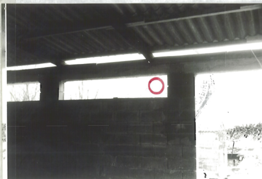
Position de l'O.V.H.I

Fenêtre par laquelle monsieur a vu la première fois l'engin.