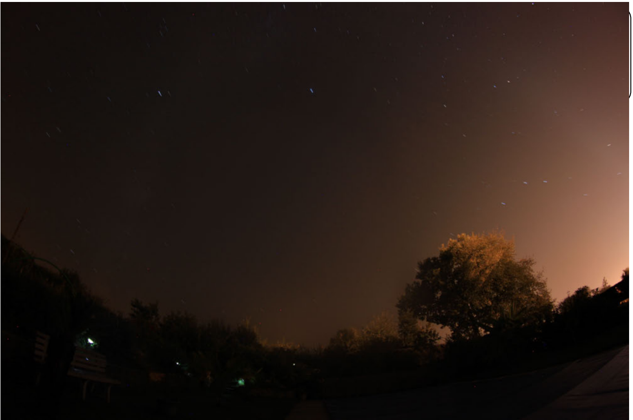
Ci-dessus: photographie suivante, 30 secondes après la précédente, l'objet a disparu.