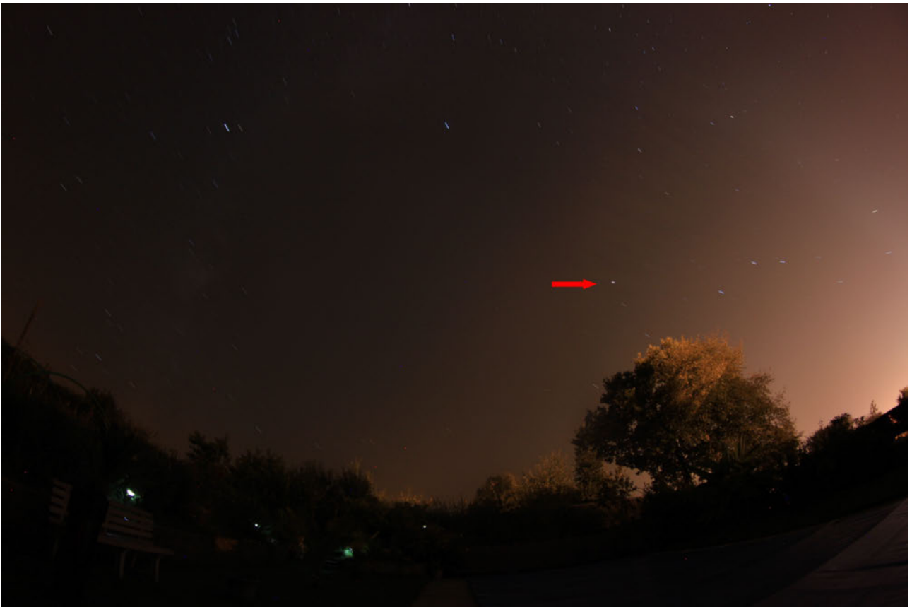
Ci-dessus, l'objet pointé.