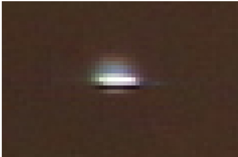
Ci-dessus: l'objet, zoomé. On distingue une barre sombre sous l'objet lumineux.