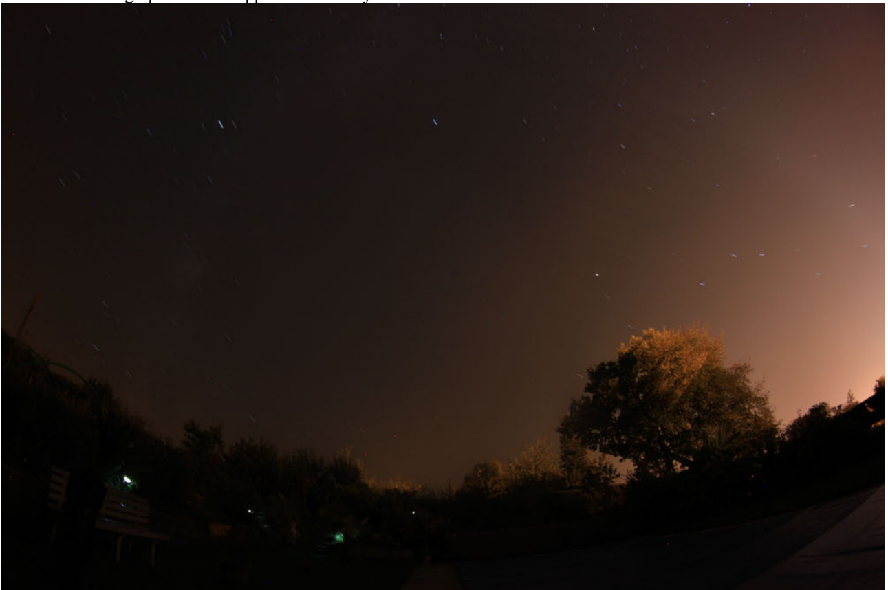
Ci-dessus: photographie avec l'objet apparu au dessus de l'arbre, stable durant la pose de 5 minutes a contrario des étoiles.