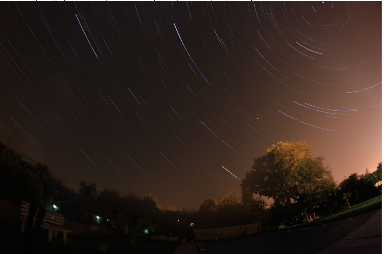
Ci-dessus: filé d'étoile obtenu (superposition des images à l'aide du logiciel StarMax, qui superpose les parties les plus lumineuses d'une image).