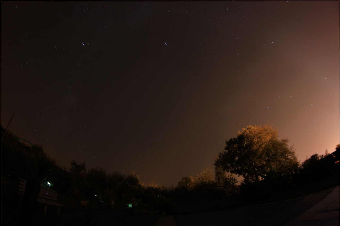
Ci-dessus: Photographie avant l'apparition de l'objet.